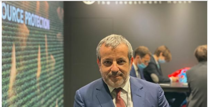
Il commento del presidente di Tendercapital in occasione della Giornata Mondiale del Risparmio