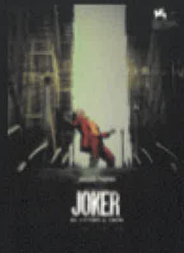
JOKER ORE 18:50