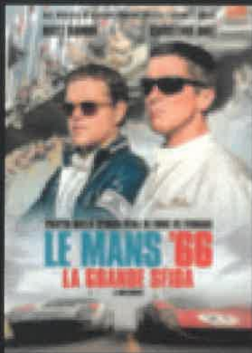
LE MANS '66 LA GRANDE SFIDA ORE 11:30