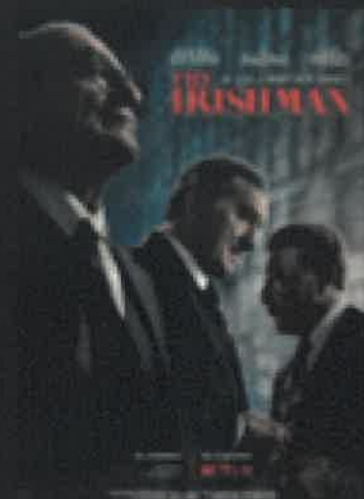
THE IRISHMAN ORE 14:40