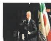
Zingaretti rischia disastro e querela. Insula Salvini: "l'ubriaccone del Papeete"