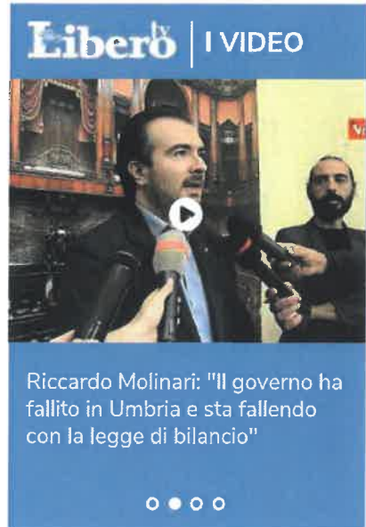
Riccardo Molinari: "Il governo ha fallito in Umbria e sta fallendo con la legge di bilancio"