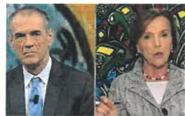
"Cosa penso di Quota 100" Fornero, ribaltone in diretta: Salvini gode, Renzi no / Video