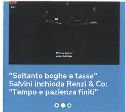
"Soltanto beghe e tasse" Salvini inchioda Renzi & Co: "Tempo e pazienza finiti"

"La tragica eredità di Monti". Tutta la verità sulla manovra, Bagnai: "Un buco mai visto"