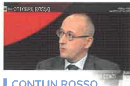
CONTI IN ROSSO