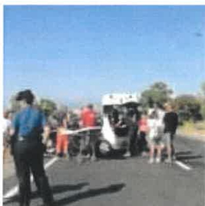
Incidente sulla 106 a Roccella, 83enne muore dopo un mese di agonia