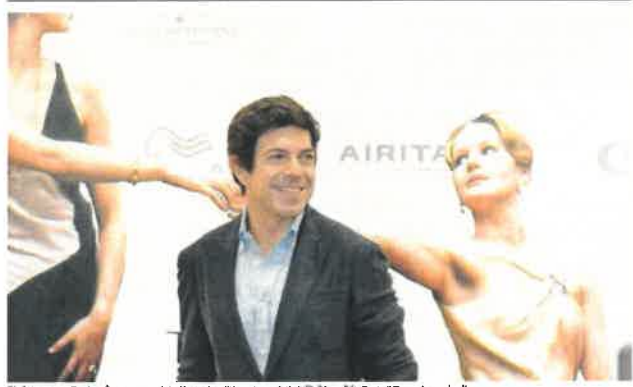
Pierfrancesco Favino è stato uno dei più applauditi protagonisti dell'ultimo FilmFest di Taormina, a luglio

La serata finale sarà sabato (con inizio alle ore 21), con altri grandi ospiti: Lino Guanciale e Mamma Mandra echi, per la consegna dei premi al miglior progetto di Teatro e Teatro-Lazio inDivenire si prega quest'anno di esplicitare un evento di grande rilevanza, che accompagnata la durata del festival, dal 20 settembre al 12 ottobre: la mostra ID SO(G)NO i minori non accompagnati stranieri è raccontata attraverso la fotografia. Si tratta del risultato di un progetto dell'UNHCR, Agenzia ONU per i Rifugiati e dell'Autoscuola Garante per l'Infanzia e l'Adolescenza (AGIA) rivolto a minori stranieri non accompagnati ospiti di due strutture di accoglienza di Roma.