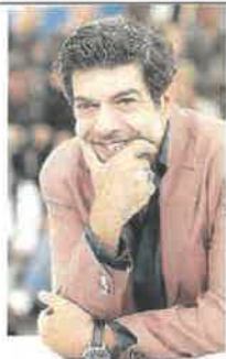
L'attore Piefrancesco Favino