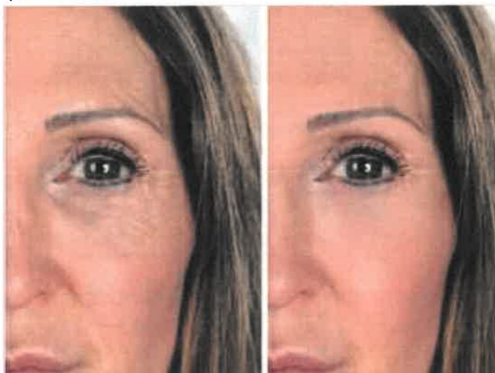
Crema viso + contorno occhi ad un prezzo incredibile! Attiva lo sconto Suisselab