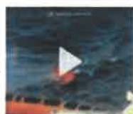
CRONACHE Migranti, naufragio di Lampedusa nel video della Guardia Costiera