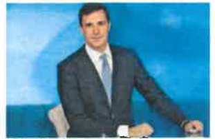
"Mattino Cinque" il conduttore Francesco Vecchi