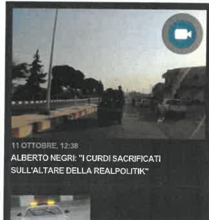
11 OTTOBRE, 12:38 ALBERTO NEGRI: "I CURDI SACRIFICATI SULL'ALTARE DELLA REALPOLITIK"