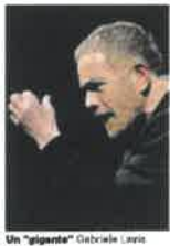
Un "giornale" Gabriele Lavia

Lavia parlerà di teatro e del suo futuro, perché come egli stesso ha dichiarato in un'intervista di qualche tempo fa: «Il teatro non può morire, morirà forse la forma dello spettacolo, ma la rappresentazione dell'uomo per l'uomo non può mo-