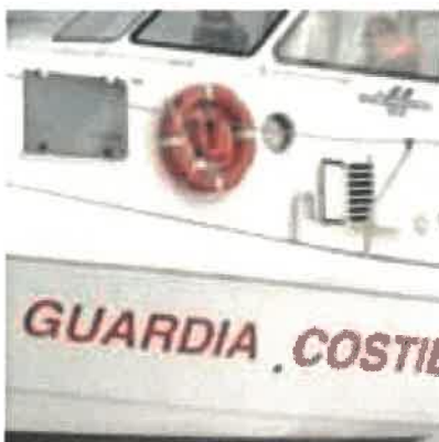
Soccorsi a Roccella 70 migranti in barca a vela