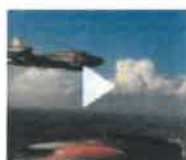
CRONACHE Aeronautica, in Italia torna a volare un jet Mb326-K restaurato