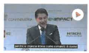
Conte: "A Governo interessa non solo il Pil, ma com.. SOTTOTITOLI"