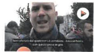
Torre Maura, Casapound: "Via i rom da centri abit.. SOTTOTITOLI"