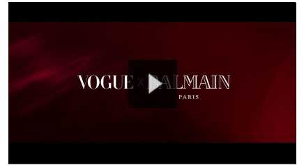
BALMAIN x VOGUE: Isabeli Fontana protagonista del nuovo video