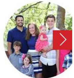
California: «Aiuto non risponde più! E ora spuntano le connessioni con l'Isis»