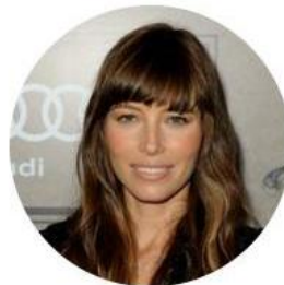
A ogni incarnato il suo colore