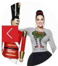
Katy Perry: «Il mio Natale»