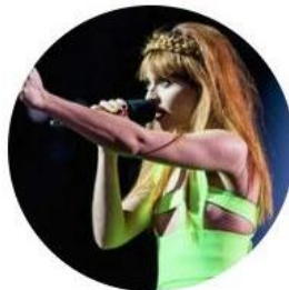
Mosek: «I nostri favoriti»